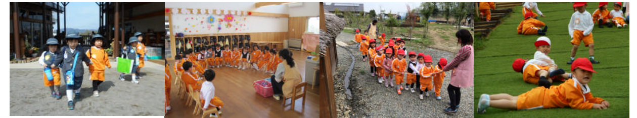
年少さん、、、年長さんと登園！ 朝の会