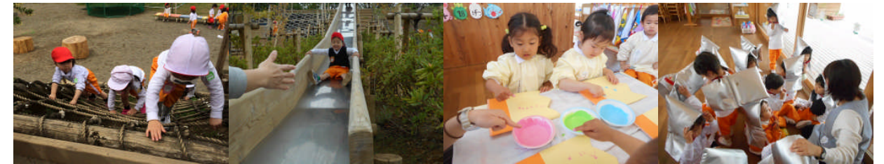
どんどん、、、広がっていきます！