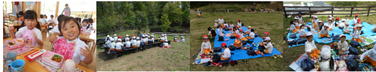
お部屋で アウトドアキッチンで 芝生で テッペンひろばで

色々な場所で、スタイルでお弁当や給食を頂きます。単調な「食べる」という活動に、環境の変化を持たせ、楽しく食べられる工夫をすることも食育の大切な要素です。