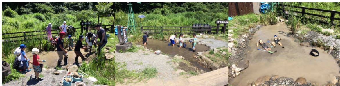
カルガモ池を整備