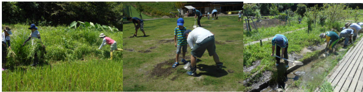
田んぼ周りの草刈り

1学期末に「鉄腕クラブ」で小川の整備、カルガモ池の整備、芝生整備、田んぼ周辺の草刈りなど、暑い中にもかかわらず、参加された皆さまに汗を掻いて頂きました。おかげさまで、二学期から子どもたちが安全に、更に楽しく過ごせるようになりました。有り難うございました！