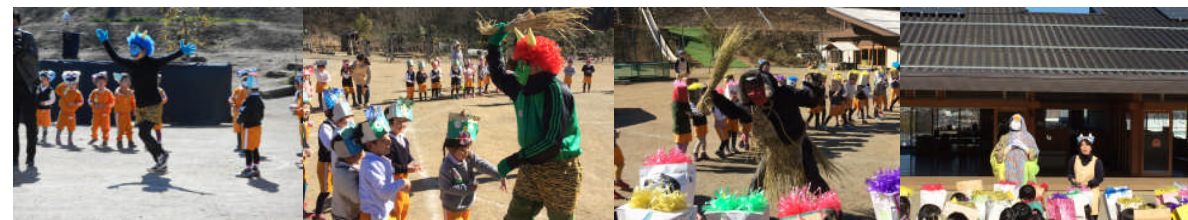
青鬼さん、 赤鬼さん、 そして??鬼? 福の神

豆まき会 お部屋で豆を食べた後、手作りの鬼のお面等をつけて園庭に集合。学年ごとに制作した作品を紹介し合い、いよいよ豆まきのスタート！ 年少、中、長、それぞれにいろいろな鬼が現れました。みんなで力を合わせ「おには～そと！」。段々と弱っていく鬼に、担任が「豆がら」と「柊鯛(ひいらぎいわし)」を見せると、鬼は降参し逃げていきました。すると「福の神」が現れ、みんなに福をもたらしてくれました！これでみんなの心の中の鬼もいなくなり、1年間元気に過ごせます！！