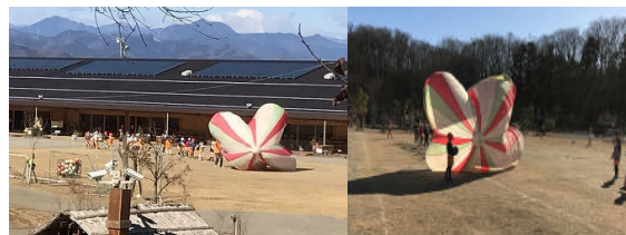
北風小僧つかまえた！ 春一番つかまえた！

生活発表会の取り組みから得た成長 生活発表会には大勢の方にお越し頂き有り難うございました。皆様の温かい眼差しと大きな拍手のおかげで、子ども達も存分に表現できたことと思います。お子様が入園されてからこれまでの歩みを振り返り、大きな成長を感じて頂けたら幸いです。1人1人が自信を持って新たな一歩を踏み出していくことでしょう。