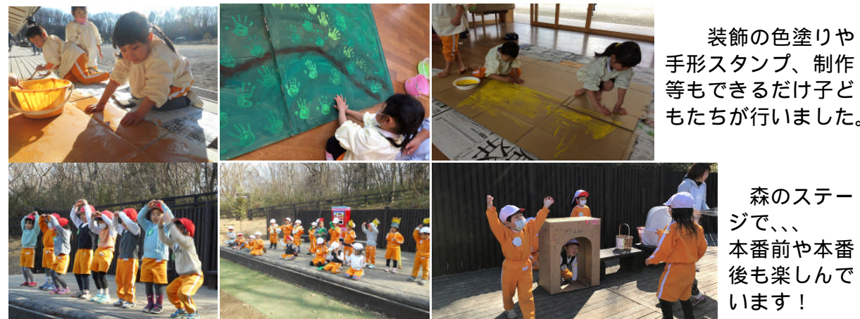
装飾の色塗りや手形スタンプ、制作等もできるだけ子どもたちが行いました。

劇発表の出来映え以上に、これまでの“過程”を通しての成長を認め、讃えて頂けたら幸いです。園としても、保護者の皆さまにそうした“過程”をよりご理解頂けるよう、今後工夫をこらしていきたいと考えています。